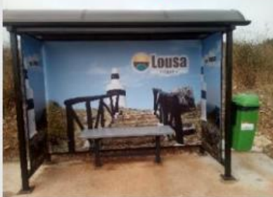
Recuperação do Abrigo Passageiros em Tocadelos