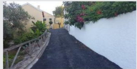
Pavimentação da Rua do Rio da Fonte em Cabeço de Montachique