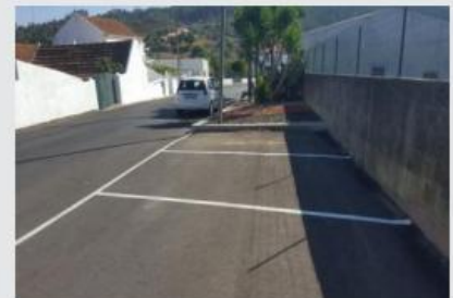
Execução de marcação elementos no pavimento e lugares de estacionamento em Vale Baleia, Montachique e Casal dos Vais.

JF Louisa procedeu à abertura das inscrições para explicações gratuitas , por forma a valorizar e apoiar a educação dos jovens estudantes residentes em Louisa, nas disciplinas de Português, Inglês e Matemática.