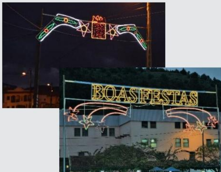
Iluminação de Natal pelas ruas da Freguesia