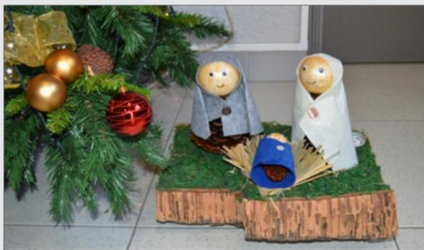
Árvore de Natal da Escola Básica de Lousa exposta no Jardim Público de Lousa

A Junta de Freguesia recebeu a visita dos alunos do Ensino Estruturado da Escola B. de Lousa, que vieram trazer o seu Presépio de Natal para a nossa Árvore de Natal. Elaborado à base de materiais naturais, este ano os elementos utilizados foram cortiça, pinhas e palha, complementados com outros elementos decorativos.